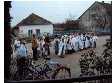
Általános Iskolások lucáznak

Lucát jöttem köszönteni, adjanak egy kicsit hőrpinteni, vagy egy pohár pálinkát, vagy egy pohár borocskát, mind a kettőt meginnám. Tyúkok, ludak tojjanak, malacos legyen a disznójuk, borjas legyen a tehén. Amennyi szekér széna, szalma, annyi legyen a lányok kérője.