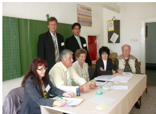
(Országgyűlési képviselő választás – munkában a Bizottság)