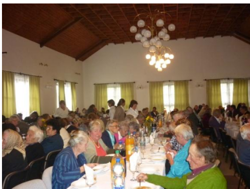
(Idősek Napja 2010.)