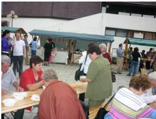
(Kistérségi kavalkád – nyugdíjasaink Sárospatakon)