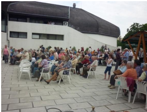
(Kistérségi kavalkád – nyugdíjasaink Sárospatakon)